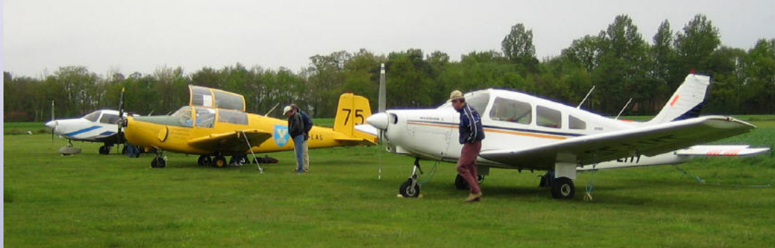
EDWH Oldenburg-Hatten vid eskadern 2005.